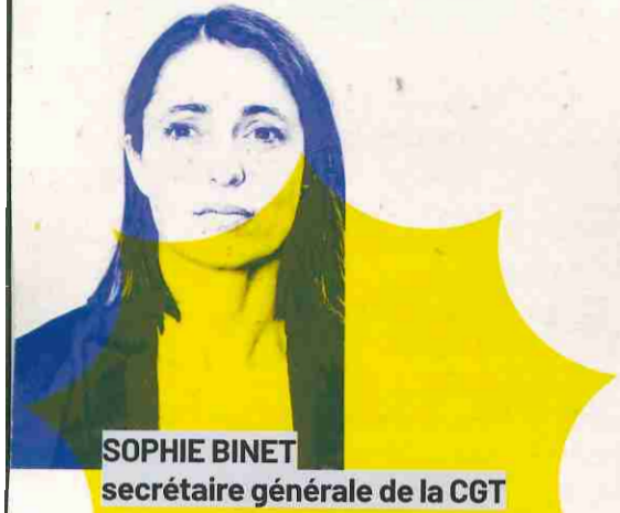
SOPHIE BINET secrétaire générale de la CGT

Grâce à notre mobilisation historique, le sujet des retraites est toujours au centre de l'actualité. Le gouvernement a été contraint d'ouvrir des concertations et les parlementaires doivent ensuite voter. Patronat et gouvernement font tout pour empêcher l'abrogation de la réforme mais notre mobilisation va faire la différence. Une large majorité de Français-es comme de député-es sont toujours opposé-es à la réforme. Financer